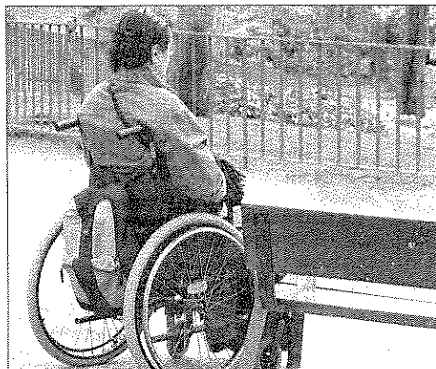
En España hay más de dos millones de personas dependientes.

Libro Blanco de la Dependencia, que se presentó en diciembre pasado y que "es un documento riguroso que recoge los datos sustantivos sobre este problema", como explica Amparo Valcarce, se-